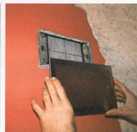
► Dans chaque pièce, les entrées d'air sont dotées de filtres. Aux entrées d'air de la machine, les particules sont filtrées. La prise d'air extérieur est munie d'un filtre pour les grosses particules. Tous doivent être régulièrement nettoyés. La régulation intègre une alerte sur les pertes de charge.