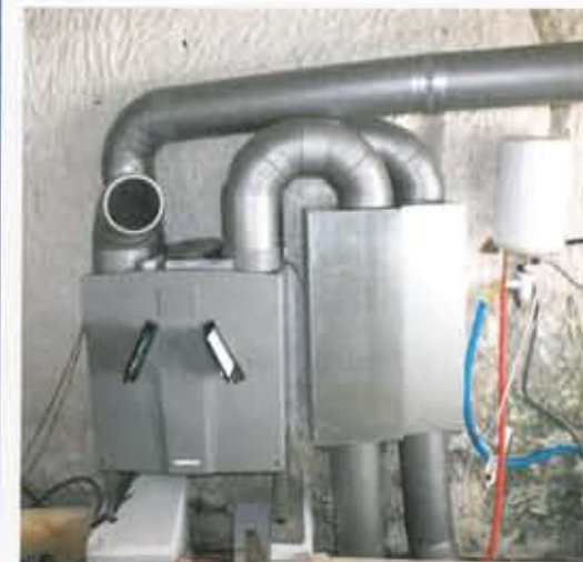
► L'air extérieur passe dans l'échangeur afin d'être réchauffé avec l'air sortant. L'air réchauffé passe alors dans un silencieux pour atténuer les bruits et est acheminé vers le distributeur qui l'envoie dans chaque pièce via un réseau de gaines. L'air vicié suit un chemin inverse.

Retrouvez ce chantier en vidéo sur www.lemoniteur.fr/etv L'Entrepreneur.TV