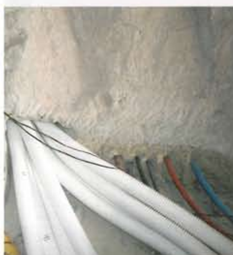
► Chaque pièce est dotée d'une arrivée et d'une sortie d'air. Cela nécessite la réalisation ventuelle de gaines techniques et/ou le percement des murs. Ici il a fallu percer des trous en pierre (tuffeau) de plus de 50 cm d'épaisseur.