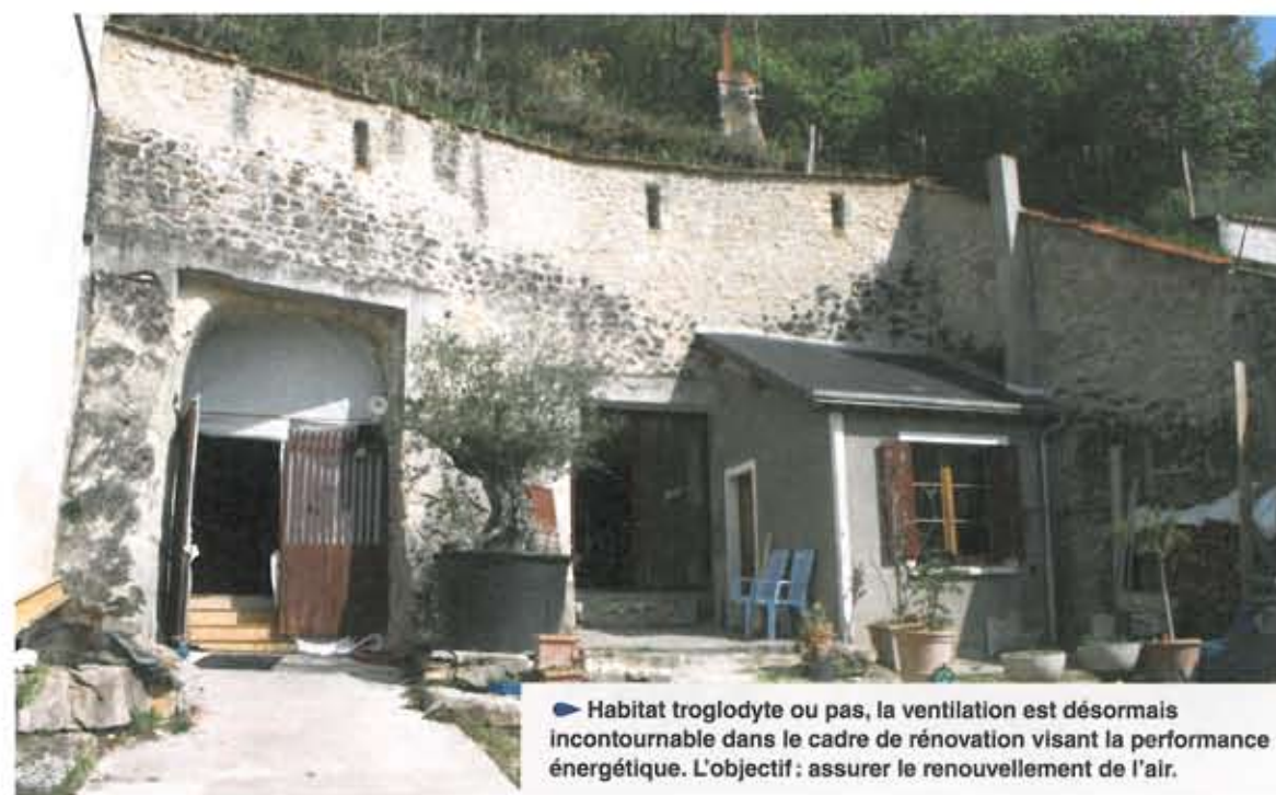
► Habitat troglodyte ou pas, la ventilation est désormais incontournable dans le cadre de rénovation visant la performance énergétique. L'objectif: assurer le renouvellement de l'air.

Pour y parvenir, la ventilation double flux est reliée à une batterie thermique (échangeur thermique) qui permet d'intégrer un chauffage connecté à une réserve d'eau de 500 L. Réserve d'eau elle-même connectée à un poêle solaires thermiques. En apparence complexe, l'installation repose, en réalité, sur un fonctionnement simple: «Le chauffage fonctionne par défaut via les panneaux