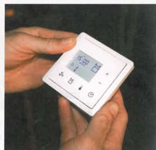
► L'ensemble du système, chauffage et ventilation, est piloté par une régulation performante. C'est elle qui gère, en fonction de la demande en température, le réchauffement plus ou moins important de l'air par l'appoint de chauffage bois ou de panneaux solaires.