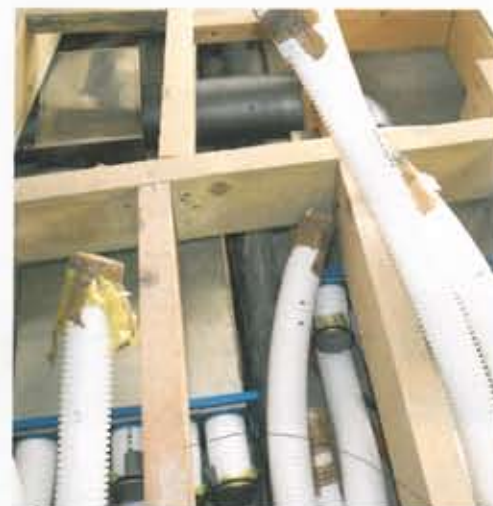
► L'ensemble des éléments techniques – collecteur, distributeur, batterie thermique – ainsi qu'une grande partie du réseau de gaines ont été installés sous un plancher technique en bois. Une solution adaptée à cette configuration et rendue possible en raison de la hauteur sous plafond.