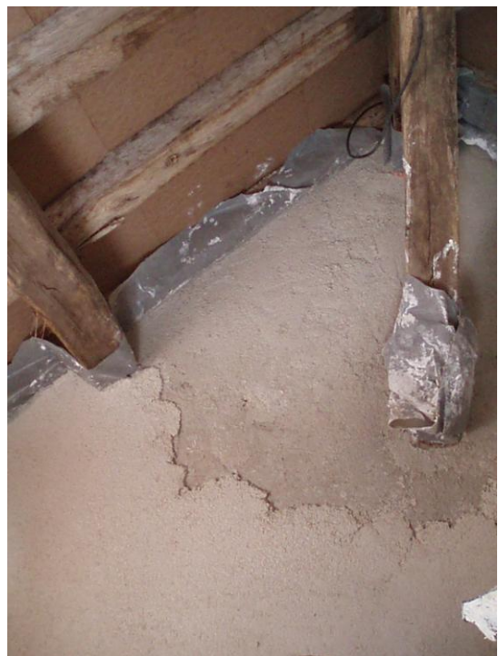
Mise en œuvre d'un enduit chaux / chanvre.