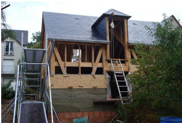
Construction d'une extension ossature bois avec remplissage chaux / chanvre.