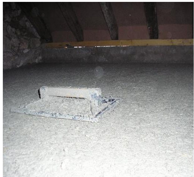
Dalle chaux / chanvre